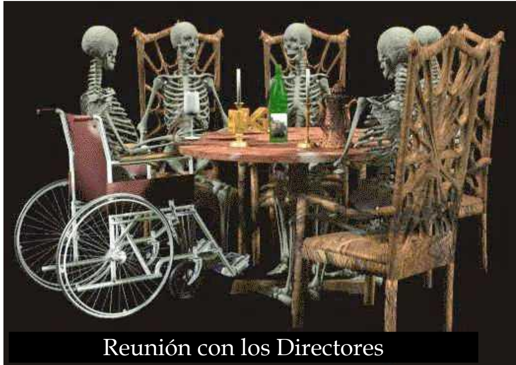
Reunión con los Directores

Aunque a algunos seguir intentando ese apoyo les lleve un poco de tiempo