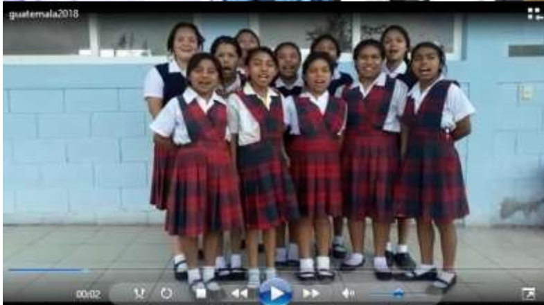
Video Casa - Hogar "Nuestra Señora de los Remedios"